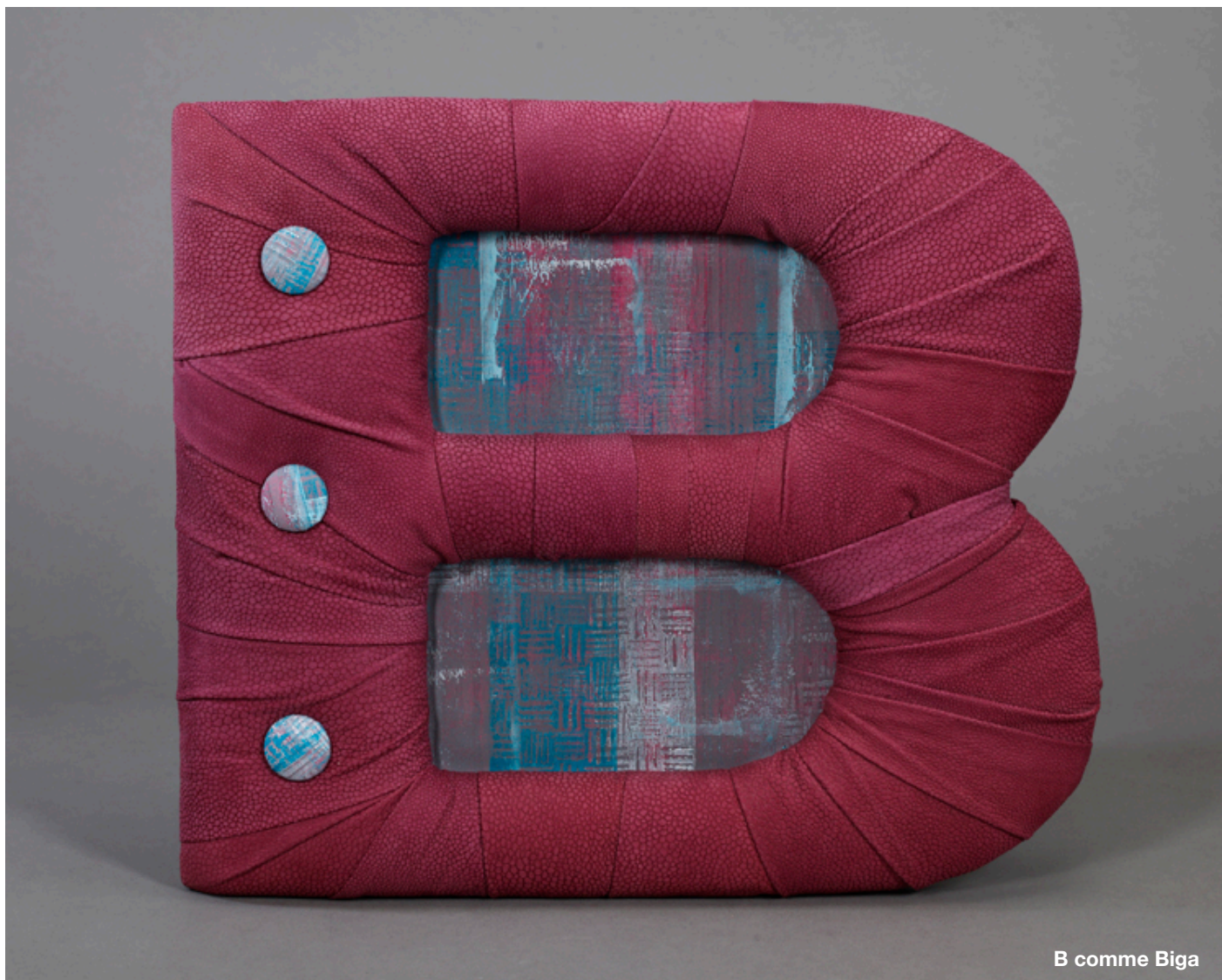
B comme Biga