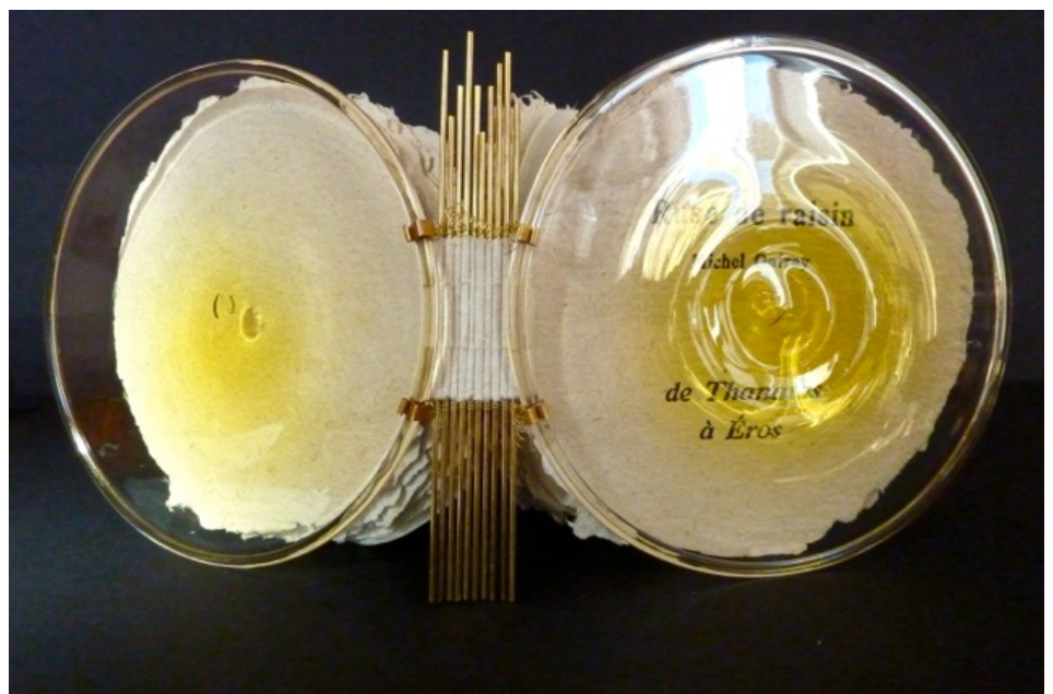
Reliure d'Hélène Logeay