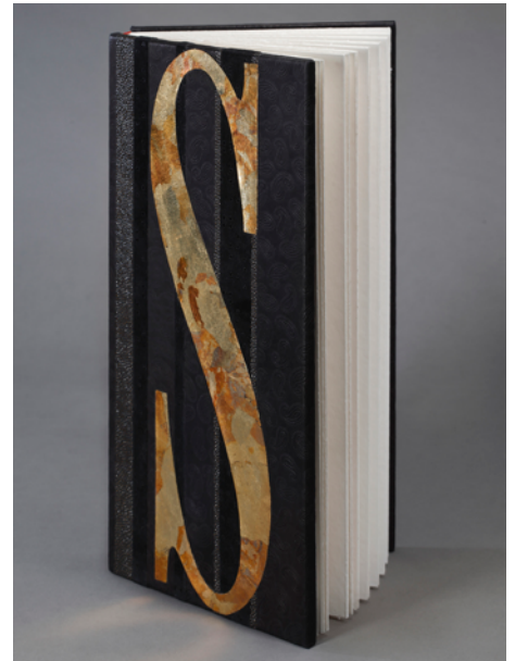
S comme Stétié